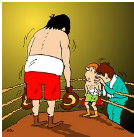
Kresba: Jozef Jurko

reformiem. Štátna správa bola organizovaná v striktnej hierarchii okolo osoby monarchu a na základoch právneho štátu. Centrálna správa bola rozdelená na občiansku a vojenskú správu a organizovaná do „Kollegier“ či ministerstiev. Kráľ menoval a odvolával štátnych úradníkov. Proporčné zastúpenie aristokracie v národnej, regionálnej a miestnej správe klesalo v prospech zastúpenia úradníkov až na približne 10% v 19. storočí. Občianska vrstva bola lojálnejšia, pretože bola priamo závislá od kráľa a nemala vlastnú politickú agendu. Na posilnenie lojality bol založený úrad Generalfiskal, ktorý bol pod vedením vrchného kráľovského prokurátora a mal špeciálnu právomoc skúmať prípady porušenia právomoci úradov kráľovskými úradníkmi. Takisto dozeral na vymáhanie nedoplatkov na daniach a všeobecne na napĺňanie záujmov kráľa, vrátane stíhania vo veciach týkajúcich sa Jeho veličenstva a štátnych zločinov.